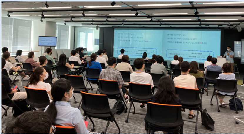
2023年9月研究会（現地開催）の様子

輸血に関する正しい知識と最新情報を発信し、 輸血検査の標準化を目的とした技術研修などを通して 会員の皆様のお役に立てるよう活動しています