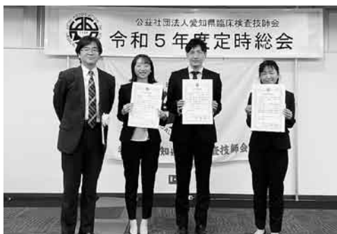
学術奨励賞受賞者