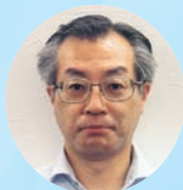
組織部知多 明 壁 均